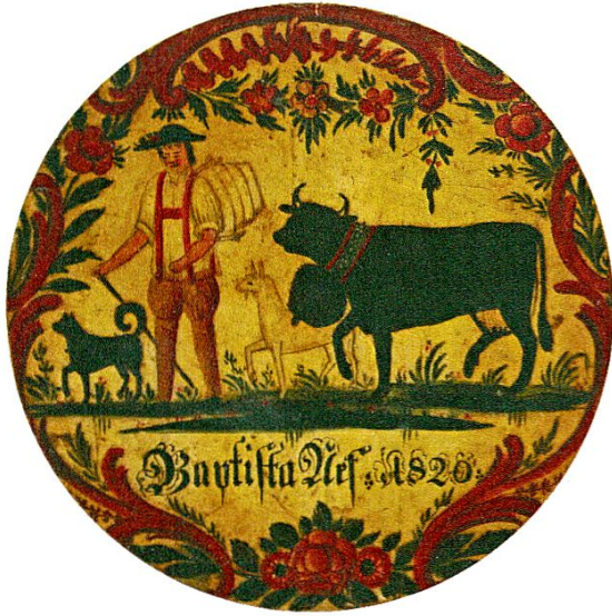
Abb. 7: Eimerbödeli für Baptista Nef 1820.