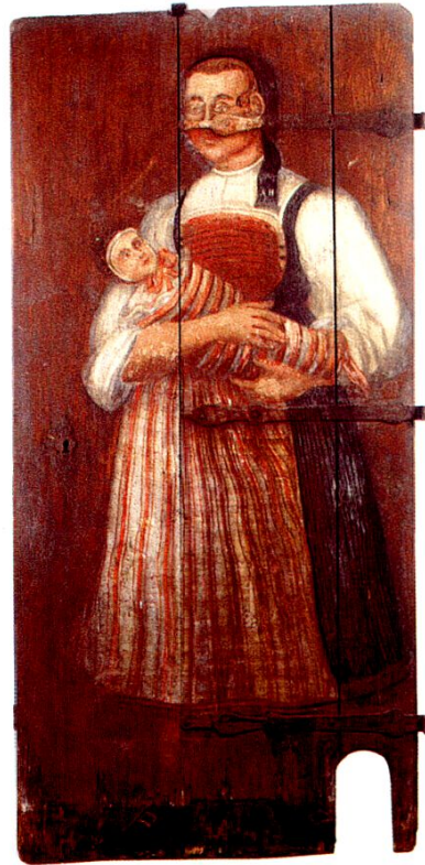
Abb. 11: Frau mit Wickelkind auf Türe.