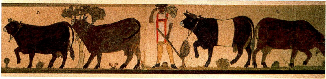
Abb. 9: Sennenstreifen, 1810. Detail.