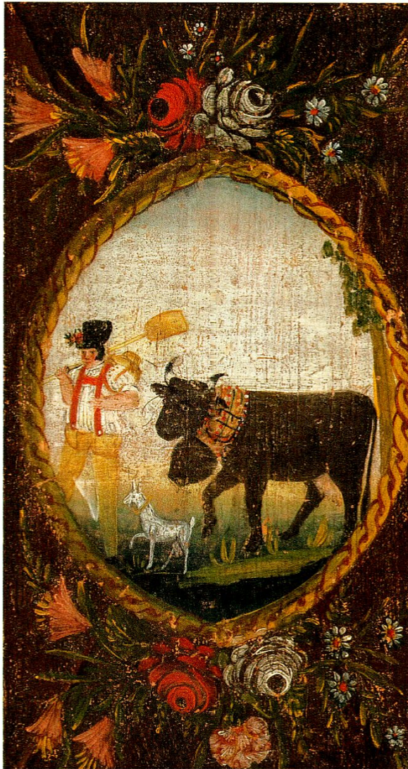
Abb. 6: Senn mit Kuh bei der Alpfahrt. Detail aus Abb. 1.

Wie bei der Darstellung des Paares auf der oberen Türfüllung ist das Motiv mit dem Sennen wieder von einer kahlen Landschaft umgeben, bei der das zarte Grün der Wiese unmerklich in den hellen Himmel übergeht. Der am rechten Bildrand knapp angedeutete Baum wirkt eher wie ein Teil der Umrahmung, die wieder von fein ausgeführten Blumen bekränzt ist.