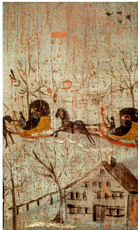
Abb. 4: Der Winter. Detail aus Abb. 1.