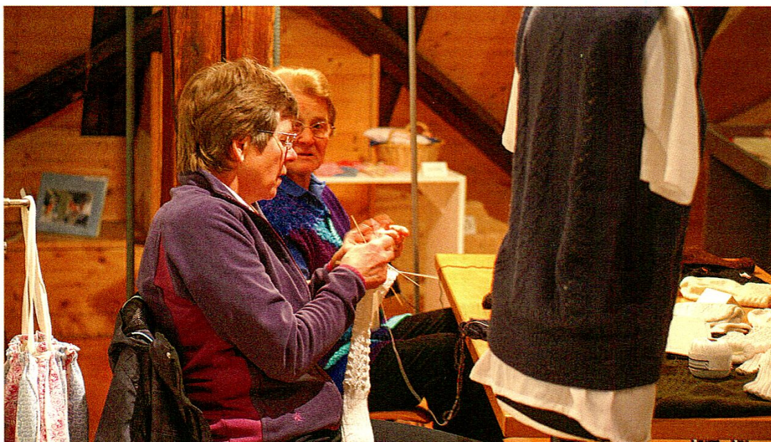
Blick in die Begleitveranstaltung «Gestrickte Lieblingsstücke» zur Sonderausstellung «Lismede».

Nachzutragen ist die erfolgreiche Durchführung der Begleitveranstaltung «Gestrickte Lieblingsstücke» zur Ausstellung «Lismede» am 22. Januar. Rund 20 Strickerinnen verwandelten den Stickereisaal in einen Stricksaal. Die Frauen zeigten Appenzeller Zipfelmützen und Trachtensocken, diverse Accessoires, Pullis und Babysachen sowie Kunststrickereien. Eine Gruppe von Schülerinnen bot zusammen mit ihrer Handarbeitslehrerin Einblick in eine Handarbeitsstunde. Musikalisch begleitet wurde der Anlass vom Zithertrio «Appenzell». Im «Sonnengarten» waren Baumstämme zu bewundern, welche Handarbeitslehrerinnen zusammen mit ihren Schülerinnen und Schülern «umstrickt» hatten. Rund 140 Besucherinnen und Besucher nahmen am Anlass teil.