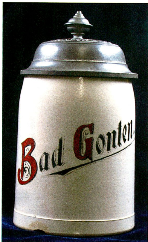
Bierhumpen, «Bad Gonten».