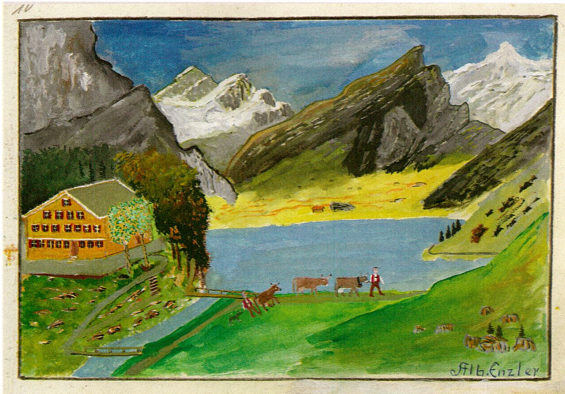
Albert Enzler (1882–1974), Seealpsee, o.J., Gouache auf Karton.

den Klassikern der «Bäuerlichen Naiven» gezählt werden kann, konnte mit dem Werk des aus Brülisau stammenden Knechts Johann Baptist Inauen eine Neuentdeckung gemacht werden.