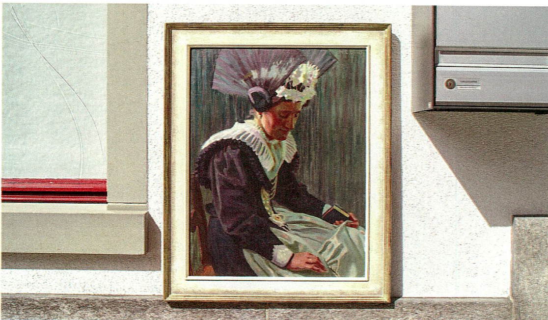
Hans Caspar Ulrich (1880–1950), Appenzeller Braut in schwarzer Festtagstracht, um 1920, Öl auf Leinwand.

Hans Caspar Ulrich (1880–1950): Appenzeller Braut in schwarzer Festtagstracht, um 1920, Öl auf Leinwand