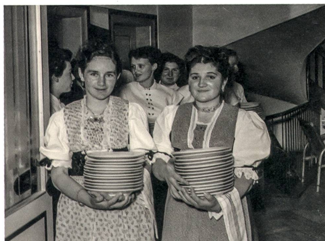
Serviertöchter des Hotels Hecht, Appen- zell, beim Auftragen der Teller, um 1950.

Die Ausstellung zeigte eine breite Auswahl an Trageobjekten, die meisten aus der eigenen Sammlung. Diese gaben einen vielschichtigen, manchmal überraschenden Einblick in die Haus- und Hofarbeit sowie den Innerrhoder Dorf- und Gewerbealltag.