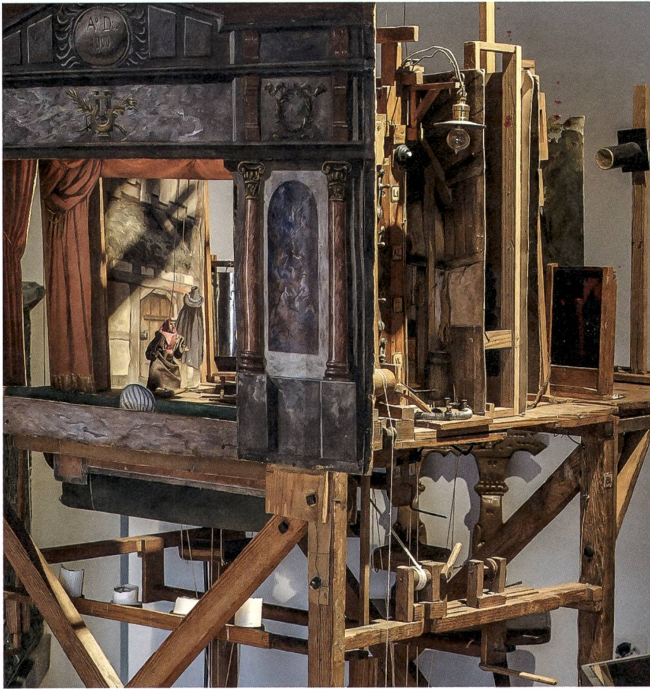
Das Marionetten- theater von Victor Tobler mit seiner ausgefeilten Bühnen- mechanik, 1900.

einen Wasserschaden. Die verschiedenen Bestandteile wurden in der Folge restauriert und erstrahlen heute in neuem Glanz. Im 5. OG (religiöse Volkskunst) wurden eine neue LED-Beleuchtung eingebaut und die Fenster mit UV-Folien beschichtet. In diesem Raum soll 2018 die Ausstellung «Religiöse Volkskunst» (Rebretter, Totengedenktafeln, Versehgarnituren, Votiv- und Andachtsbilder u.a.) neu gestaltet werden.