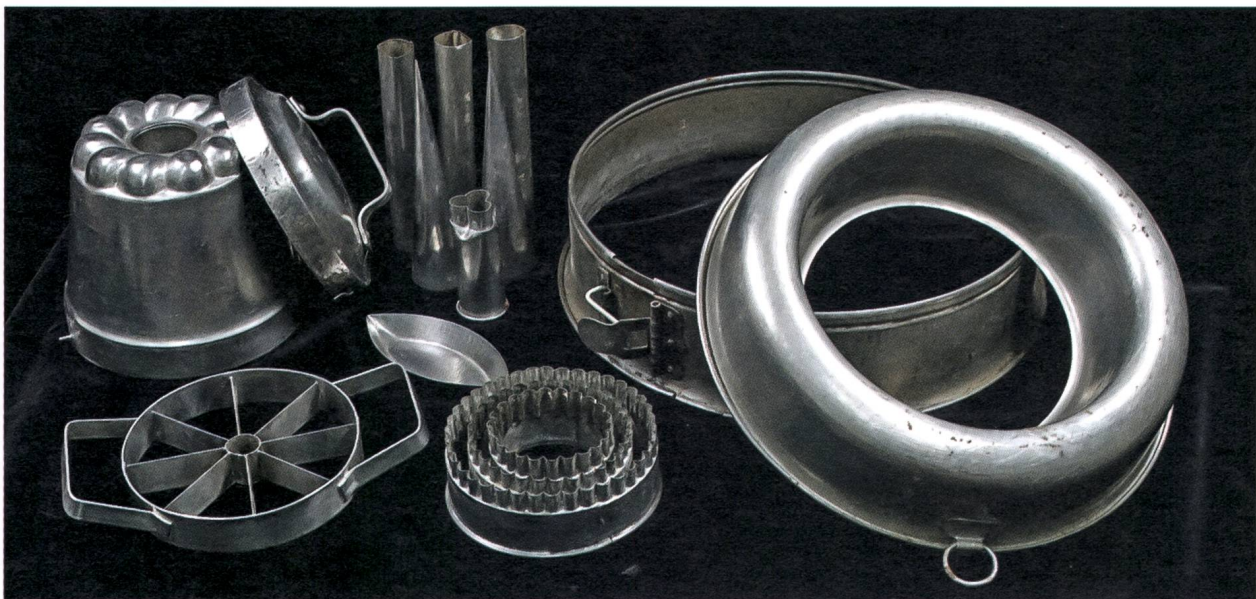
Glace- und Backformen, Ausstechformen, um 1960.

Inauen Alois und Rita, Weissbad Gastronomie- und Küchenartikel: 4 grosse Servierplatten, 2 grosse Kaffeekrüge, 2 Suppenschüsseln, Buttertöpfchen, Konfiturenschälchen, 4 Dessertschalen, Sieb, Raffeln, Kelle, Schöpfer, Rahmschwinger, diverse Back- und Guetzliformen, Glacebombe; 2 Zündholzbehälter (Fidibus); 2 Wandknaufe für Bilder; Wandbehälter für WC-Papier; Seifenschachtel mit Seifenflo-