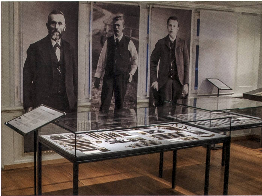
Männer in Lebensgrösse mit Uhrketten, Plots in der Sonderausstellung «Kunstvolles aus Haar».

Fotos und Dokumente aus den Molkenkuranstalten in Bad Pyrmont und Bruchsaal. Die beiden Kuranstalten wurden von ihren Grosseltern und Eltern betrieben.