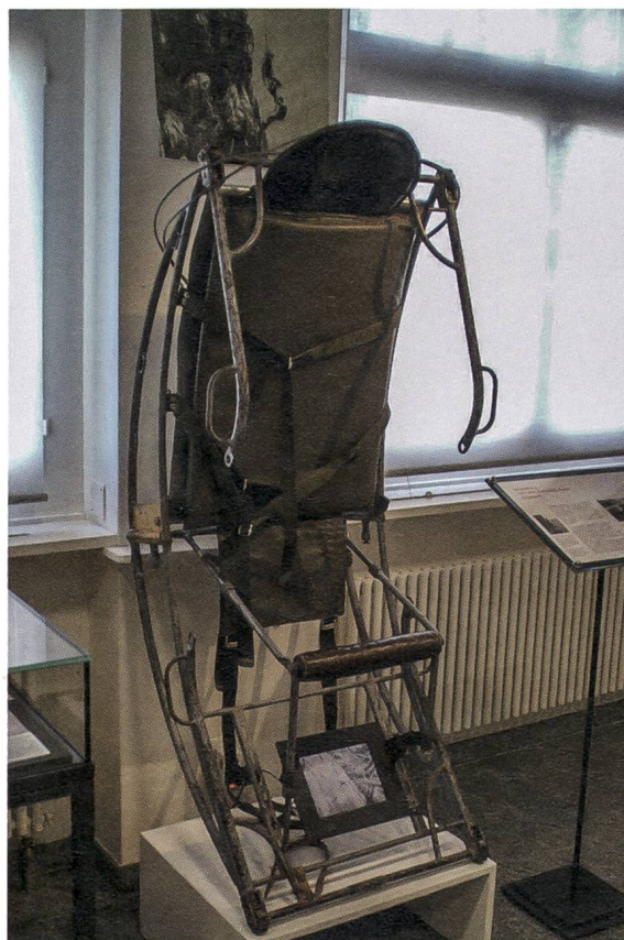
Rettungssitz für die Stahlseilrettung, um 1950.

Schulhäuser im Gringel durfte das Museum ein Alpsteinrelief sowie nicht mehr gebrauchtes Schulmobiliar entgegennehmen. Im Rahmen der Sonderausstellung «Kunstvolles aus Haar» fand das eine oder andere wertvolle Schmuckstück aus Haar Eingang in die Museumssammlung.