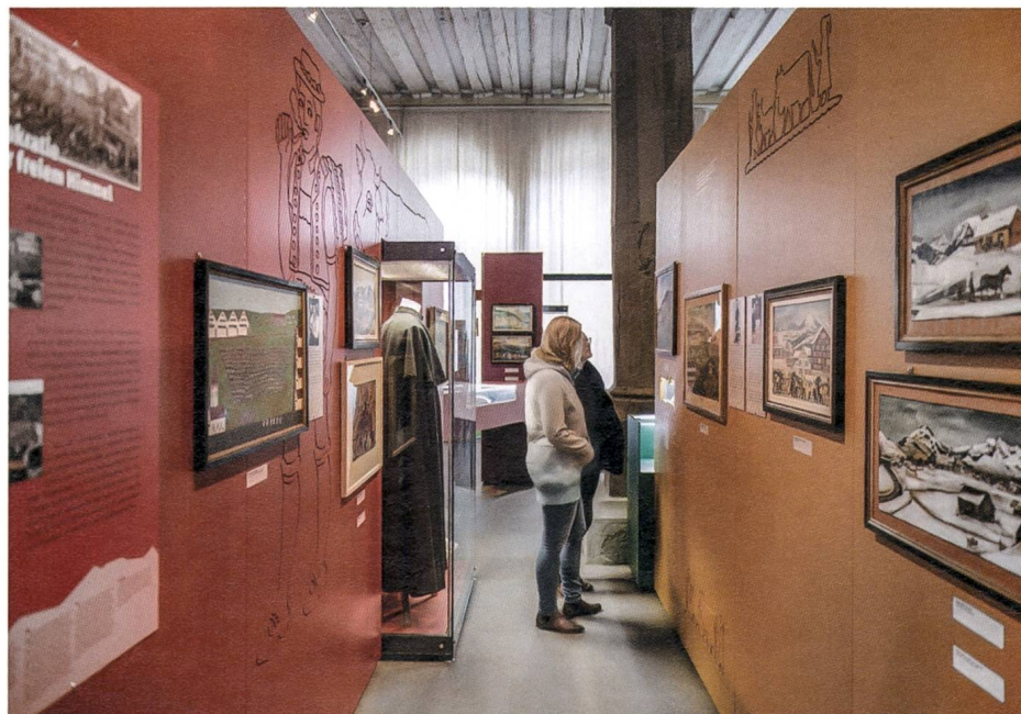
Blick in die Ausstellung «Heimat Alpstein» im Rosgartenmuseum Konstanz (Foto: Rosgartenmuseum Konstanz).

Birgit Langenegger wurde im Rahmen eines Kultur-Wochenendes zum immateriellen Kulturerbe auf den Wolfsberg, Ermatingen TG, eingeladen. In einem zweiten Teil besuchten die Gäste das Museum Appenzell, wo ihnen zwei Führungen zum Thema «Blickfang Tracht» angeboten wurden.