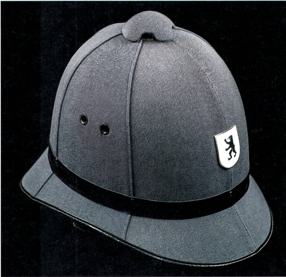
Helm zur Galauniform der Kantonspolizei Appenzell I.Rh., um 1980.

cken; Handwaschmaschine; 3 Rechen; 2 Fotoalben, diverse Fotos; 3 Heiligenbildchen