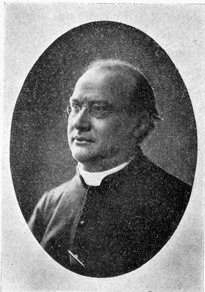
† Decanatedral R. Mod. Tuor.

per igl uestgiu! 52 onns de tala veta sacerdotala. Cun buna raschun ha dompropst Willi en siu classic plaid de bara ils 20 de Fevrer 1912 schau passar quels 52 onns avon la scantschala principala digl uestgiu sco onns fretgeivels e pleins