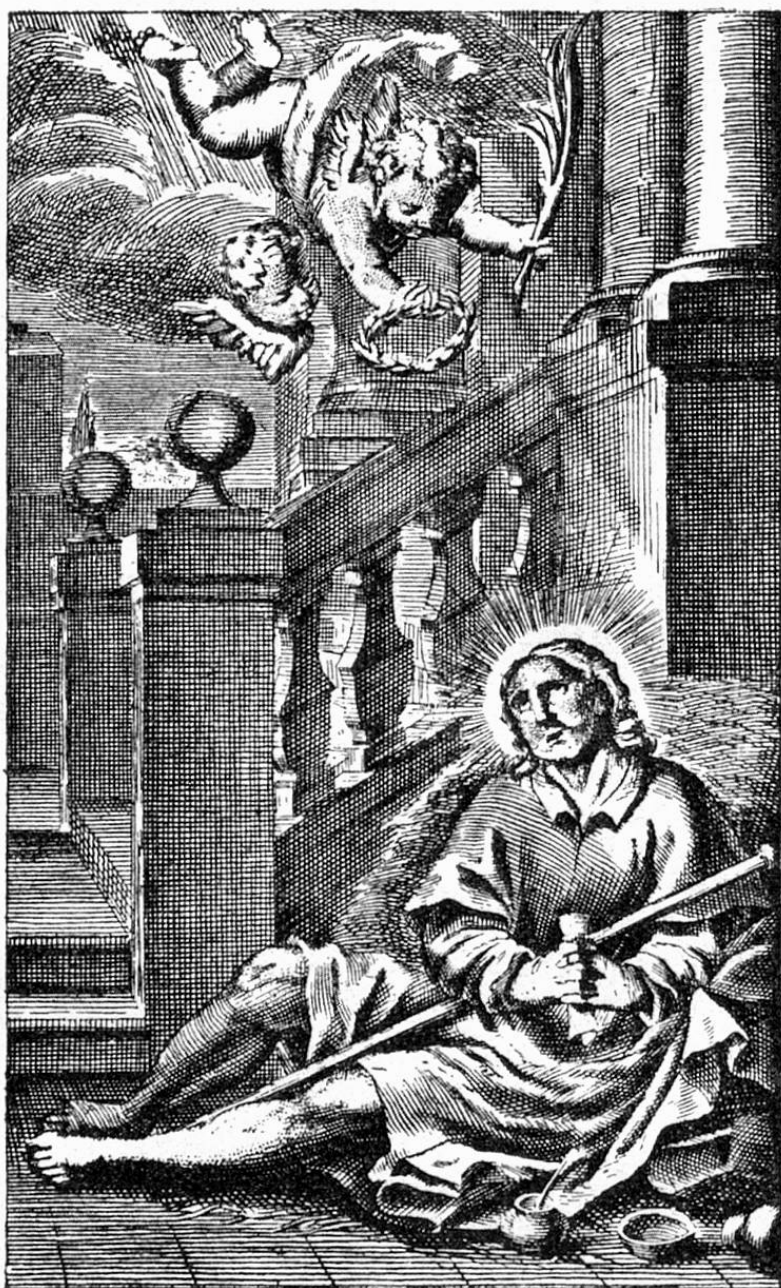
S. ALEXIUS, Equitis Romani Filius.