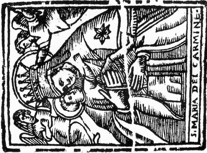
2. Nossidunna dil Carmel