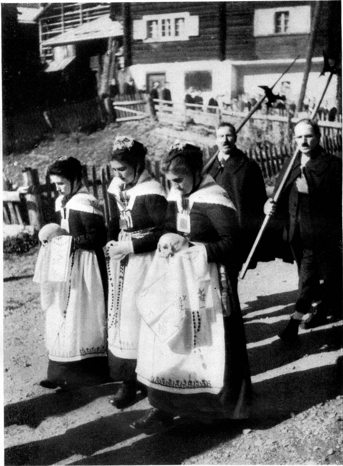
Las Treis Marias