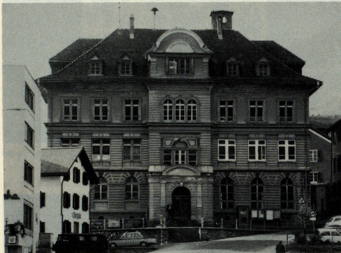
La casa da scola veglia a Glion, dimora dalla scola professionala da 1910–1957 e lu puspei da 1971–1977