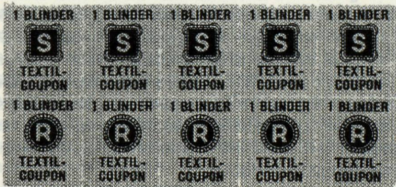
Marcas da raziun dalla davosa uiara