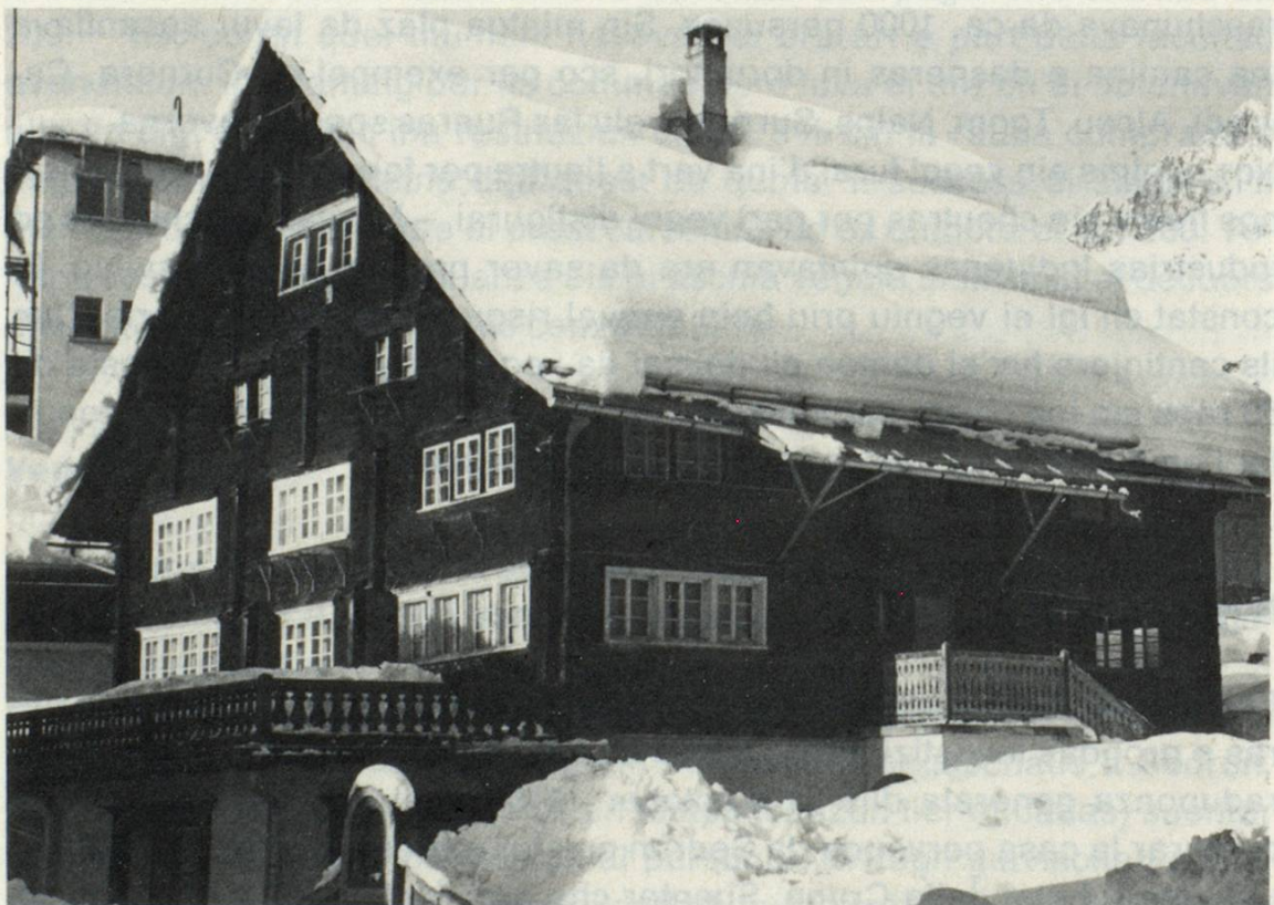
La veglia casa parvenda a Sedrun. Suten la stizun dil Consum liber

il plaun-terren cun aunc engrondir il sulom engiu ha ei dau in stupent local da stizun cun ina grondezia da ca. 120 m 2 , dasperas in biro ed autras localitads. La casa sco tala ei restada sco ella fuvava. Il local da stizun ei puspei vegnius renovaus 1955. Damai che la casa suren fuvava empau en decadenza eis ei vegniu concludiu 1968 da disfar ella totalmein e baghegiar ina nova tenor ils plans dils architects Robert Decurtins ed Albert Dettling. Il sulom ei puspei vegnius engrondu ensi, aschia ch'il local da stizun ha survegniu in volumen da ca. 200 m 2 , tut bein endrizzau alla moda moderna, cun ils necessaris magasins, maschinas e suren aunc 3 habitaziuns. Ils 19 da november 1969 fuvava tut preparau ed ins ha saviu arver la stizun nova, nua che mintgin saveva ussa sesurvir sesez. Dalla casa sut via han ins saviu far bien diever duront il baghegiar. Suent'er eis ella vegnida vendida