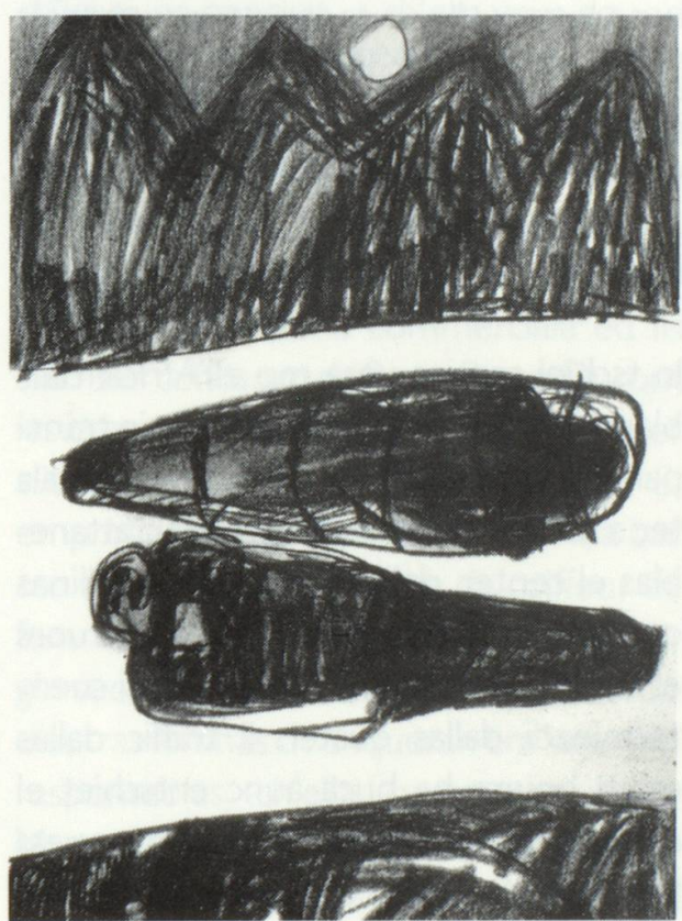
Lu eis ei puspei stgir. Las gotas sgreflan en veta