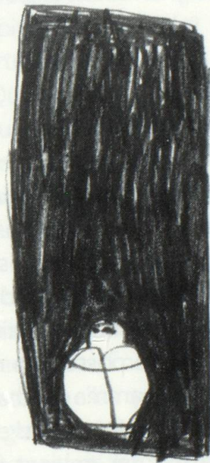
Beinduras sesent'ins aschi levs e persuls