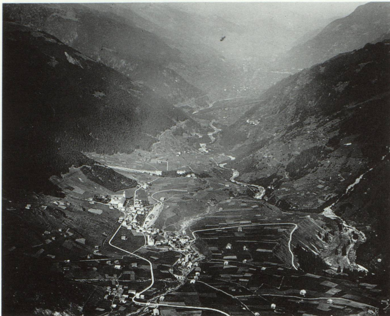
Da Mustér enviers Sumvitg