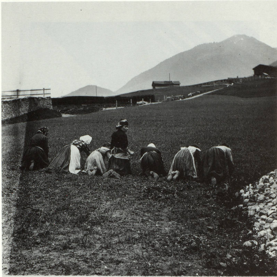
KH, Mustér, 1906