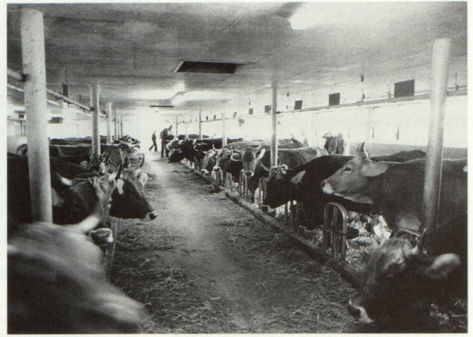
L'America vul paucs purs gronds che produceschan bia e cuostan pauc. Sch'il pur da muntogna sto semiserar sil marcau mundial cul pur American, lu va ei buca ditg pli.

Sche la spertadad crescha, sminuescha il spazi. La Svizra ei in pign spazi beinstont. Sch'il mund rotescha pli e pli spert, perda la Svizra siu beinstar e sia situaziun extraordinaria. La lavur dil pur Svizzer vegn pagada dil stadi. Da quella paga viva in entir complex agrar-industrial cun firmas, societads eav. Al pur resta la lavur. La muntogna drova biars purs pigns. Il manteniment dalla populaziun en vitgs e valladas pretenda quei.