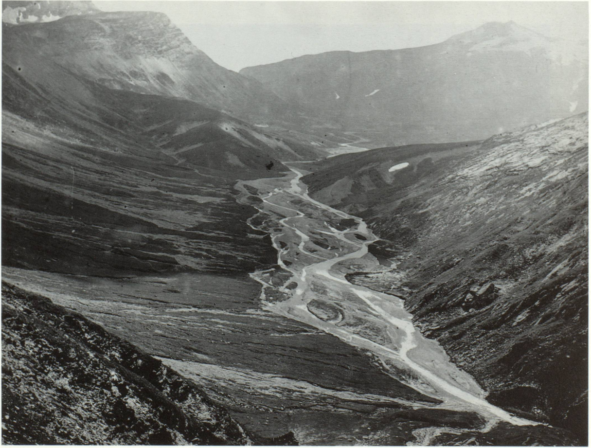
Il plaun la Greina