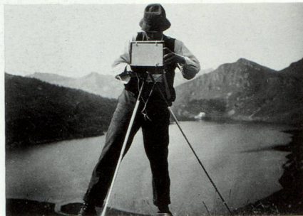
Il fotograf dalla muntogna

Dal temps da nies Derichsweiler mava aunc buca mintga tappagnac e metschafadigias a spass cun apparats da fotografar e videos e giavelequater. Fotografar viado ella natira era zatgei per glied cun inschign e pazienza e raps e gnarva e bunas combas. Ils apparats, pil pli fatgs da nu