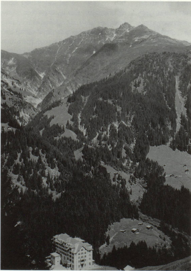
(sura) Pez Gûda e Pez Ner Pez Nadels «Grand-Hôtel Waldhäuser» e «Villa Greina», 1911