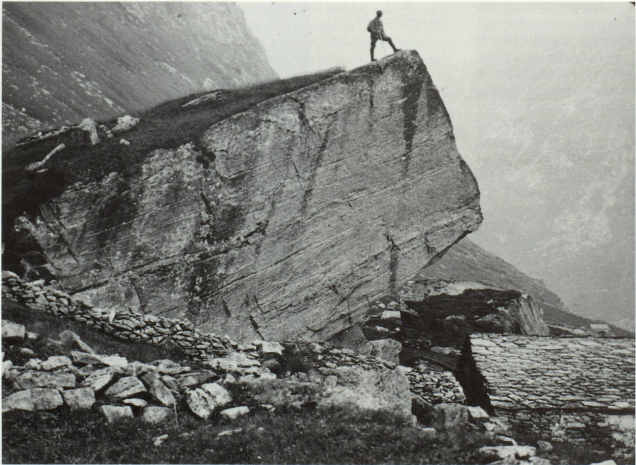
Ella Zervreila 1912