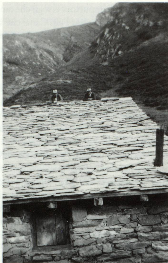
Blengias Miez, 1949