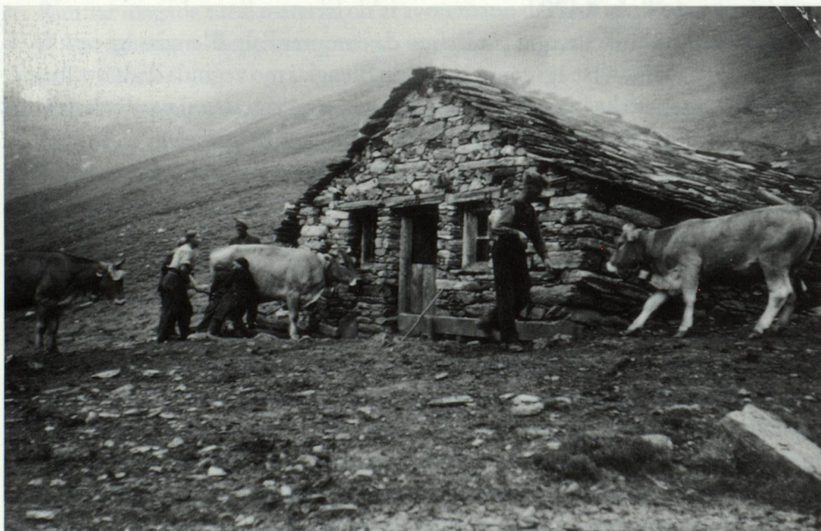
Blengias Sura, 1946

El 15avel tschentaner dat ei entginas dispetas denter ils vischins da Semione ed Aquila. Il cussegl dalla val Lumnezia sto intermediar in'emprema gada 1473 denter las duas vischnaucas. Igl interess per territori el Grischun era daventaus gronds. Il motiv dalla carplina ei l'alp Blengias. La partida da Semione cumpra en consequenza la mesadad dallas brevs da pègn: l'alp e las duas tegias vegnan partidas si denter las duas vischnaucas. Plinavon vegn era concludiu che neginas dallas partidas astgien far donns sil terren da l'auter e quei ni da primavera, stad ni d'atun.