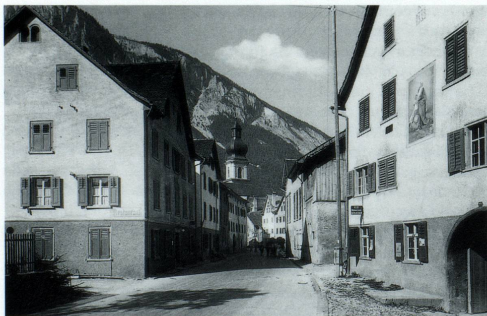
1939: Quella fotografia muossa la Gassa gronda naven dall'entschatta dalla Gassa surò en direcziun dil center. Quella part dalla Gassa gronda vegneva era numnada Gassa Sumvic ni Gassa sura.