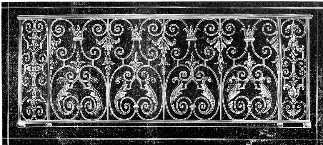
Gitterwerk von der Brühl'schen Terrasse in Dresden.

solcher Schutz für unsere Muster und Modelle noch nie energisch genug verlangt wurde.