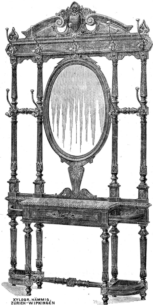
XYLOGR. HÄMMIG, ZÜRICH-WIPKINGEN