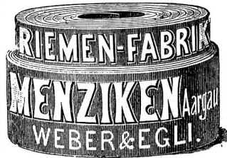
Medaille Genf. ——— Telephon.

Kernleder-Treibriemen in vorzüglicher Qualität verfertigt die 322