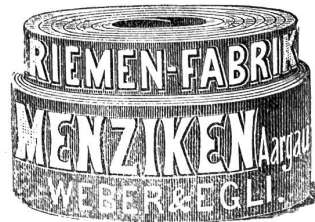
Goldene Medaille Thun 1899. Telephon.

Neuer Schlagriemen (Anti-Chrom-Gerbung) 230 vorzügliches Fabrikat, la Ledertreibriemen.