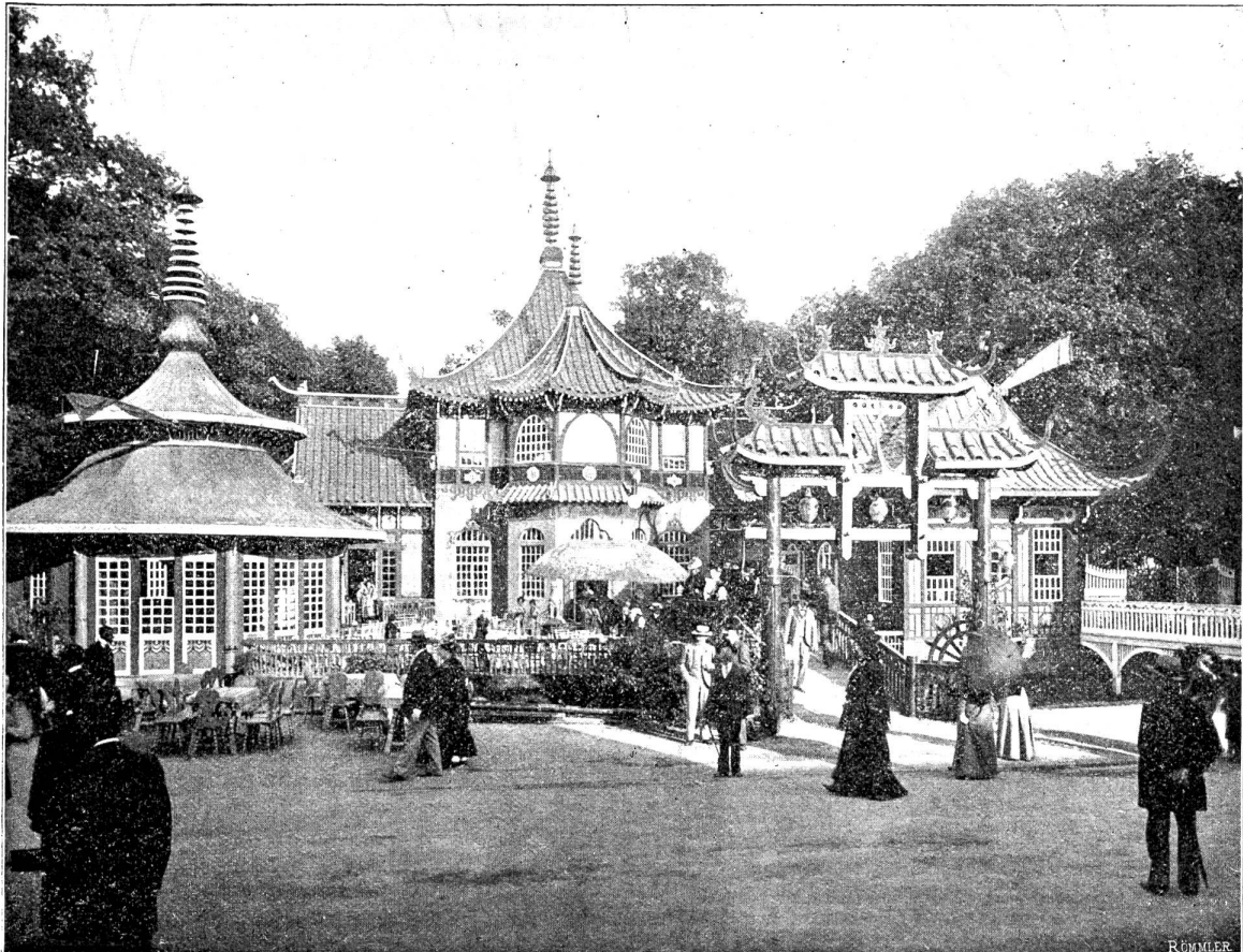
☞ Thecpavillon. ☛

brücke zu dem reich mit Lampions behangenen chinesischen Babilon und da wie dort auf der Terasse des Reichsbaues, im pompeianischen Saale der Römer, in der gemüthlichen harzduftenden Stube der Siegfriedschmiede und in den mit Weinlaub umrankten Nischen des Kunstgebäudes wird getrunken, geschertzt und gelacht.