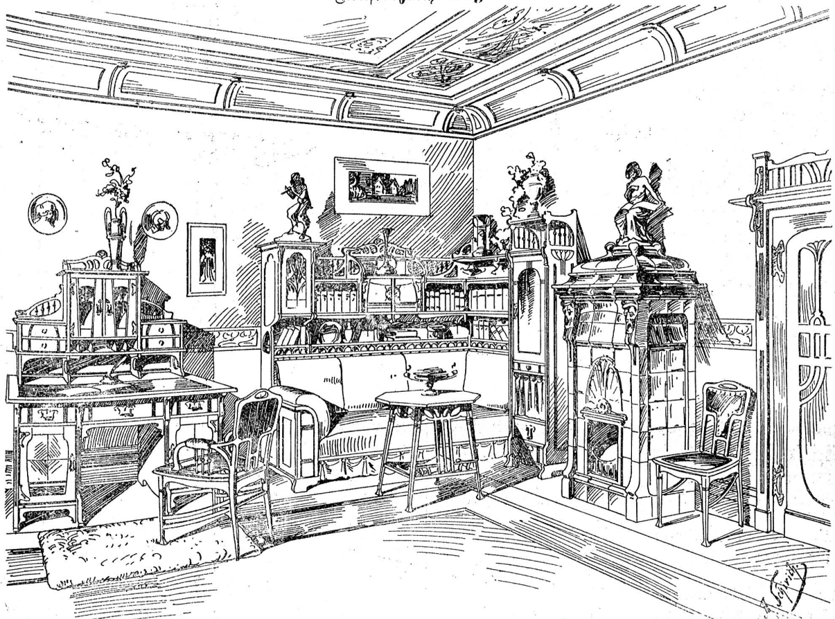
Bibliothek- und Arbeitszimmer im Charakter des modernen englischen Stils.