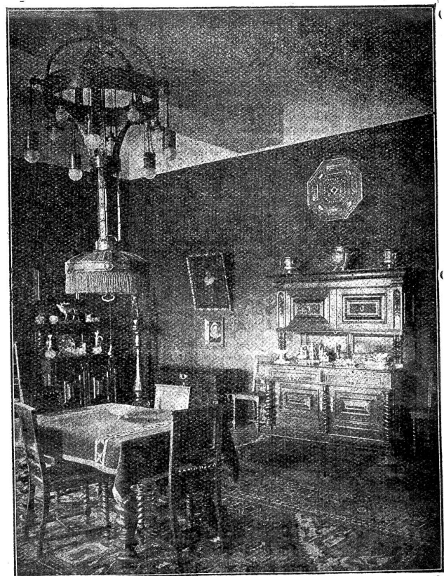
Der Zephyr-Lüfter mit Prof. Junkers Lamellen-Kalorifer. Vertreten in der Schweiz durch Wanner & Co., A.G. Abteilung für ventilations-technische Anlagen, Dürren.

gering. Sind z. B. die zusammenhängenden Gesellschaftsräume eines herrschaftlichen Wohnhauses mit zusammen etwa 300 m 3 Rauminhalt zu kühlen, wozu etwa 900 m 3