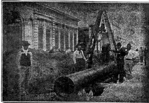
Verlegung überlapptgeschweisster Muffenrohre für die Wasserleitung von La Plata (Argentinien)