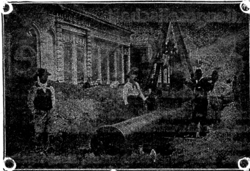
Verlegung überlapptgeschweisster Muffenrohre für die Wasserleitung von La Plata (Argentinien)