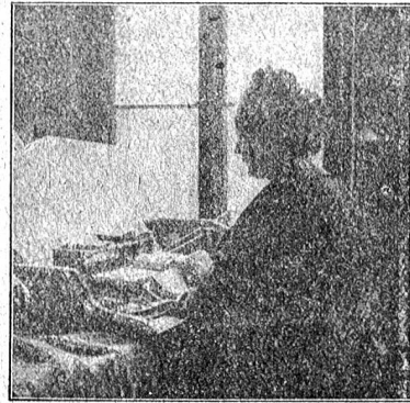
Abbildung 7. Beschneiderin in voller Arbeit.

Dieses Gold läßt sich wegen seiner allzu großen Weichheit nur sehr schwer herstellen, und es wird daher fast