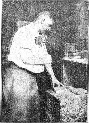
Abbildung 6. Arbeiter bei der Dünnschlagform.

So kann es dann vorkommen, daß 80 mm Blättchen auf z. B. 79×81 mm gehen; derartige für die Beschneiderin unmerkliche Größenunterschiede sind auch bei sorgfältiger Behandlung des Beschneideapparates eine Fabrikations-Möglichkeit.