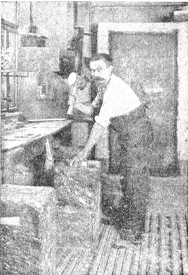
Abb. 8. Ein für die Schweiz arbeitender Staniol-Blattgoldschläger.

Zwecke nicht verwendet werden. Natürlich spricht bei der Haltbarkeit auch der Untergrund eine große Rolle; ebenso ist es begreiflich, daß kräftige Doppelgolde mehr Glanz ausströmen als einfache Golde, auch wenn sie punkto Feinheit gleichwertig sind. Wir haben seit Jahren in unsern Staniolgolden, das heißt in Staniol verpackten Golden, etwas Spezielles für Maler und Vergolder geschaffen, und die teuerste Qualität, die wir hierin führen, kommt auf Fr. 90.— per 1000 Blatt = 9 Rappen pro Blatt.*) Das Verkaufen pro Buch ist viel weniger übersichtlich als unser auf 1000 Blatt gehende Preis. Natürlich werden auch für Spezialarbeiten noch weit stärkere Golde geliefert, Golde, die eben in der Dünnschlagform weniger lang behandelt werden und somit dicker bleiben. Bei der Berechnung von Vergoldarbeiten möge man als Basis nehmen, daß für den Quadratmeter Fläche zirka 200 Blatt benötigt sind.