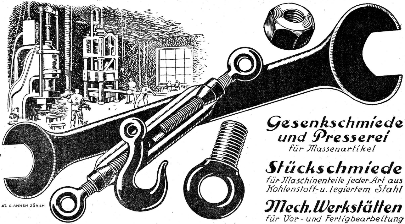
AT. C. ANNEN ZÜRICH

Gesenkschmiede und Presserei für Massenartikel