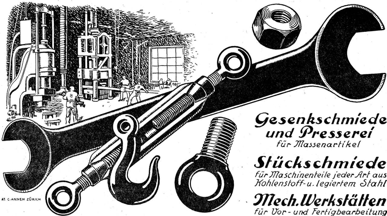
AT. C. ANNEN ZÜRICH

Gesenkschmiede und Presserei für Massenartikel