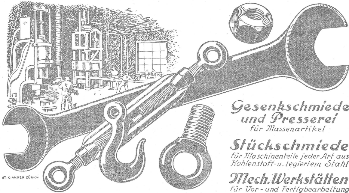
AT. C. ANNEN ZÜRICH

Gesenkschmiede und Presserei für Massenartikel