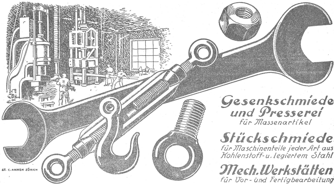
AT. C. ANNEN ZÜRICH

Gesenkschmiede und Presserei für Massenartikel