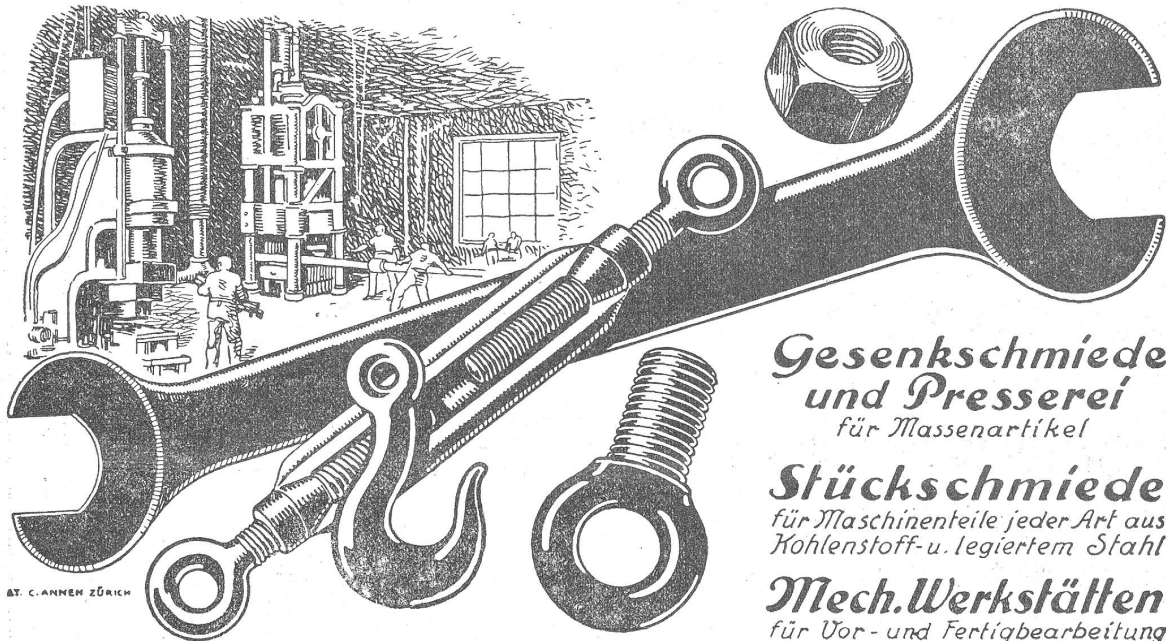
AT. C. ANHEN ZÜRICH

Gesenschmiede und Presserei für Massenartikel