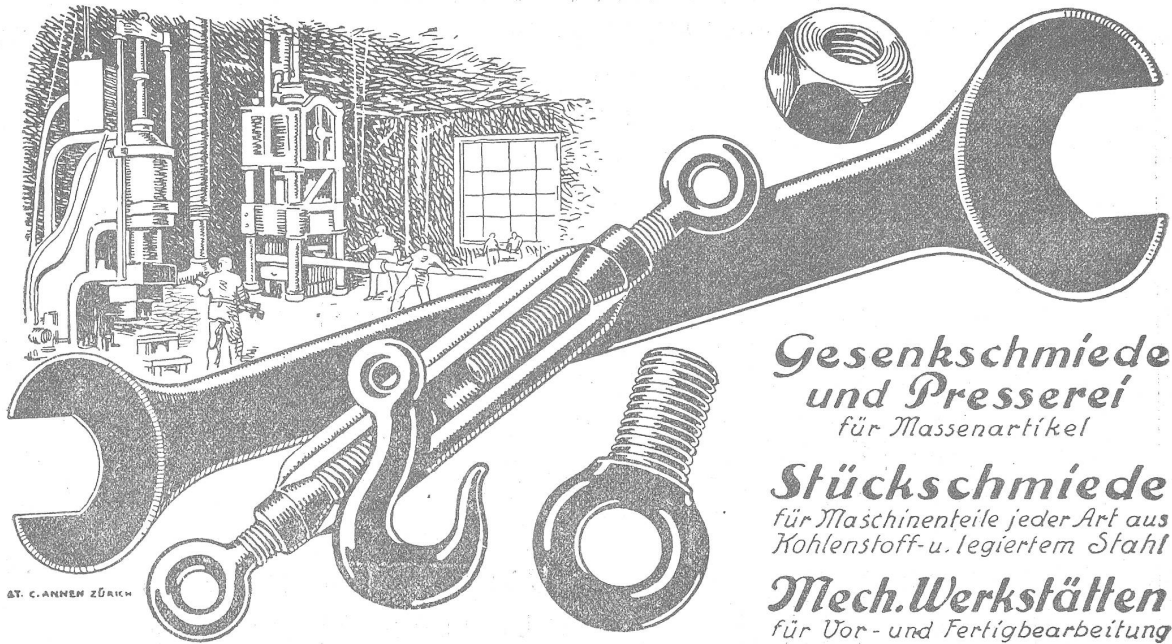
AT. C. ANHEN ZÜRICH

Gesenkschmiede und Presserei für Massenartikel