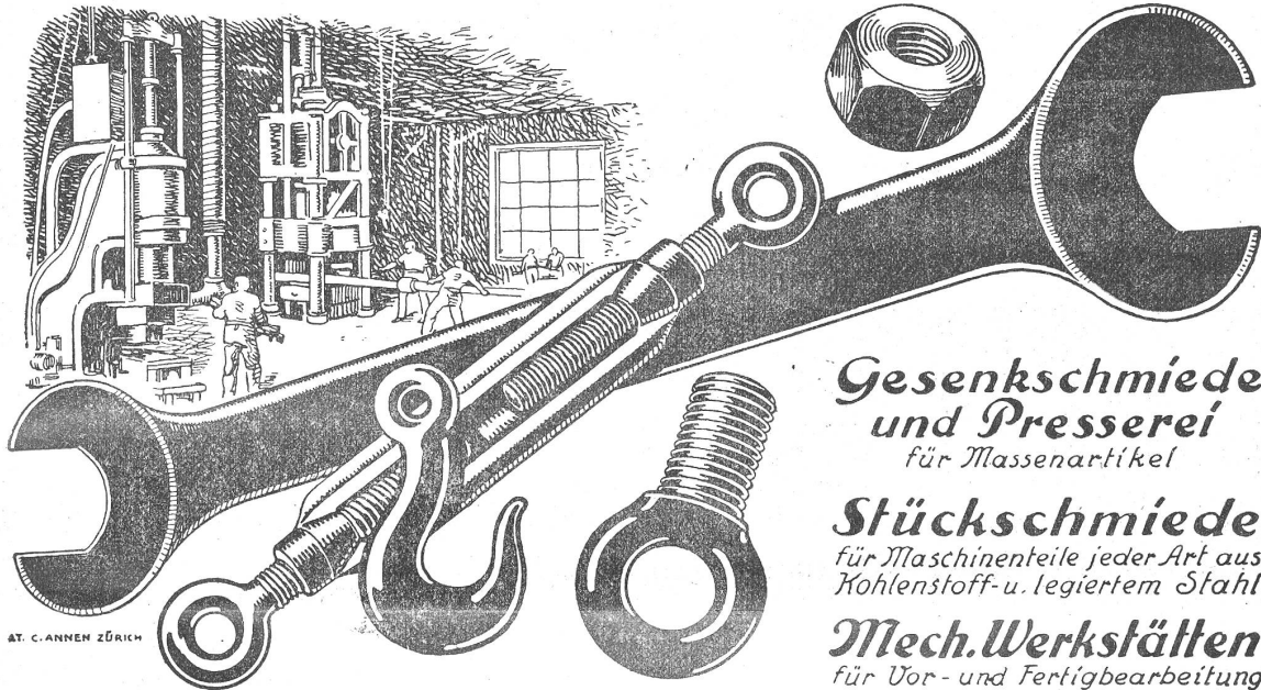
AT. C. ANNEN ZÜRICH

Gesenkschmiede und Presserei für Massenartikel