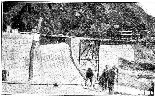
Abbildung Nr. 4. Staumauer Selmersee, von der Luftseite. Fahrgerüst teilweise abgebrochen.

k. Baudaten und Unternehmer der größeren Bauten. In einem bautechnischen Blatt gezeichnet es sich, die Unternehmungen für die größeren Bauten und Lieferungen zu nennen: