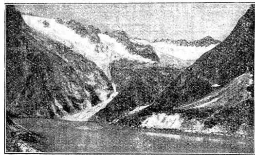
Abbildung Nr. 5. Landschaft östlich des Selmersees.

11. Staumauer am Selmersee, 380 m lang, 30 m hoch. Beginn der Installationen: Frühjahr 1927; Vollendungsfrist: 1. August 1929. Unternehmer: Ingenieur Seeberger, Frutigen.