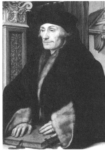
«Erasmus von Rotterdam» von Hans Holbein d.J., National-Gallery, London (1523)

Büchern, forscht er nach dem, «was die Welt, im Innersten zusammenhält». Doch er strebt nicht nach aussen; die zentrifugalen Kräfte bestimmen die Person nicht. Sein Blick geht nach innen. Der Mund lächelt. Es ist eine aus dem Herzensgrund kommende Freude; keine, die lodern und mit hellen Flammen brennt. Es ist eine tiefglühende Freude. Ein stiller Frieden hat sich auf das Gesicht des Weltweisen gelegt. Sicher war es der sehnsüchtige Wunsch des Erasmus, einen solchen freudvollen Frieden zu finden, denn als illegitimer Spross eines Priesters war er stigmatisiert. Er hat seine Freude und seinen Frieden in der Weisheit der Wissenschaften gefunden. Die Gelassenheit, die von dem Buch, das geschlossen unter den Händen ruht, und von dem schweifenden Schauen der Augen ausgeht, wäre wohl ein guter Charakterzug in einem «Kirchengesicht» unserer Tage.