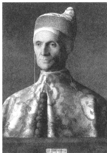
«Der Doge Leonardo Loredan» von Giovanni Bellini, National- Gallery, London (1501)

Mit grosser Strenge schaut der erfolgreiche Doge aus dem Bild. Ein Mann mit Weitblick. Er vermag zu organisieren und die gewaltige Flotte Venedigs zum Erfolg zu führen. Das Gesicht scheint fast schon zur Amtskleidung zu gehören. Das Leben als Herrscher und Repräsentant hat es hart und undurchsichtig werden lassen. Die äussere Form dominiert. Alles muss vorrangig einer Ordnung unterworfen werden. Ein solches «Kirchengesicht» ist immer dann zu finden, wenn Menschen sich von der Sehnsucht nach klaren Mustern und einfachen Aussagen leiten lassen. Freude hat dann höchstens als Freizeitereignis einen berechtigten Platz. Für den Lebensvollzug aber ist sie dann von geringer Bedeutung, da Dogmen, Formeln, Traditionen, hehre Rituale im Vordergrund stehen.