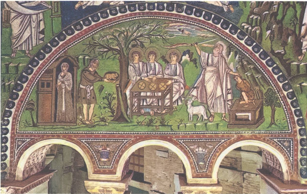
Abb. 6: Mosaik im Altarraum von San Vitale in Ravenna, 6. Jh.