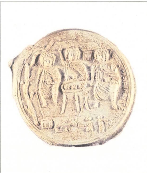
Abb. 4: Prägeform aus Palästina, 4./5. Jh., Kalkstein, Durchmesser ca. 14 cm