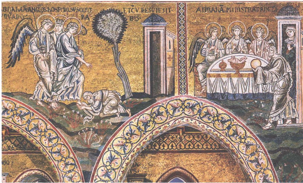
Abb. 8: Mosaik im Langhaus des Doms von Monreale Palermo, Ende 12. Jh.