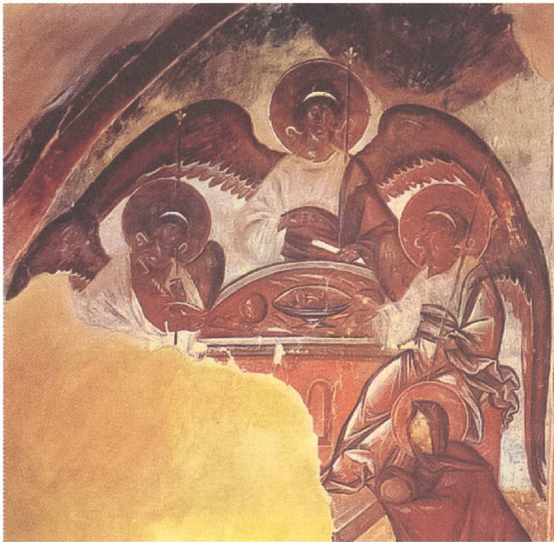
Abb. 9: Feofan Grek, Fresko in der Kathedrale in Novgorod, 1378