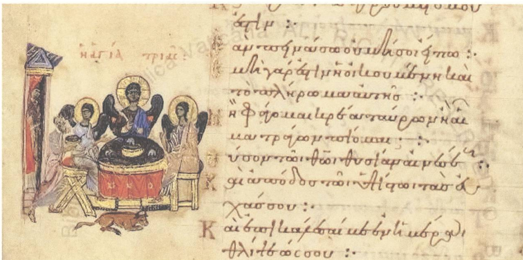
Abb. 7: Illumination einer griechischen Psalterhandschrift, Codex Vaticanus Barberinus graecus 372, fol. 85v, um 1092