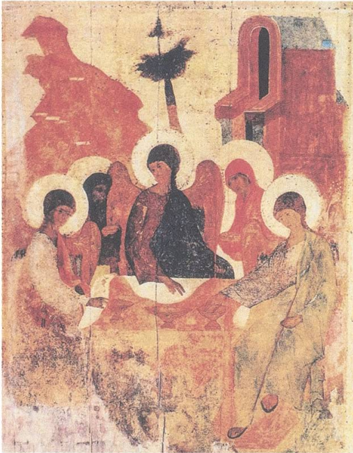
Abb. 2: Unbekannt, Ikone aus dem Dreifaltigkeitskloster des Sergij von Radonesch, frühes 15. Jh., vermutlich die Vorlage für Andrej Rubljov