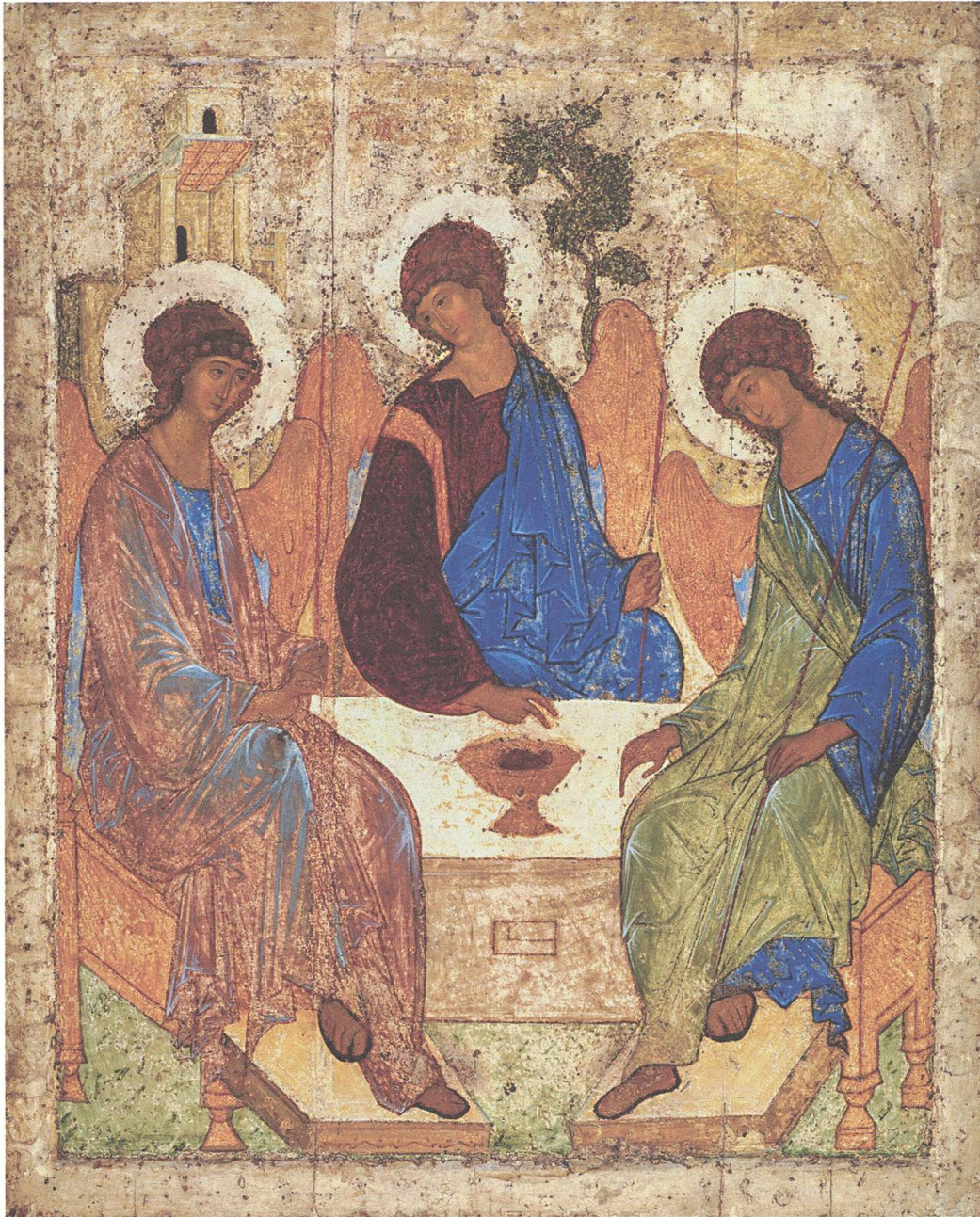
Abb. 1: Andrej Rubljov, троица – Dreifaltigkeit, ca. 1422–1427, 142 × 112 cm, ursprünglich Dreifaltigkeitskloster Sergijev Possad, seit 1921 Tretjakov-Galerie Moskau