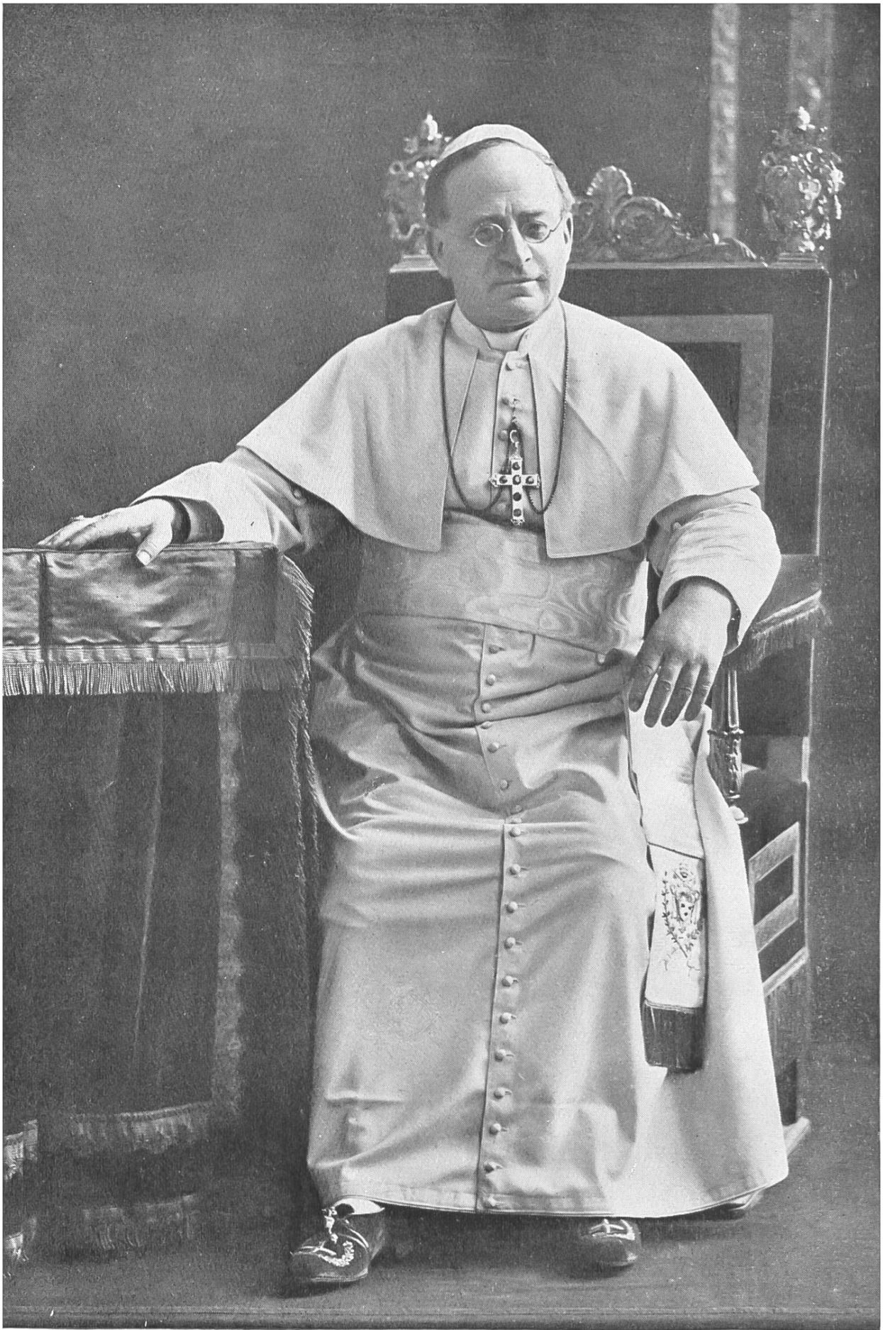
Unser Heilige Vater Papst Pius XI.