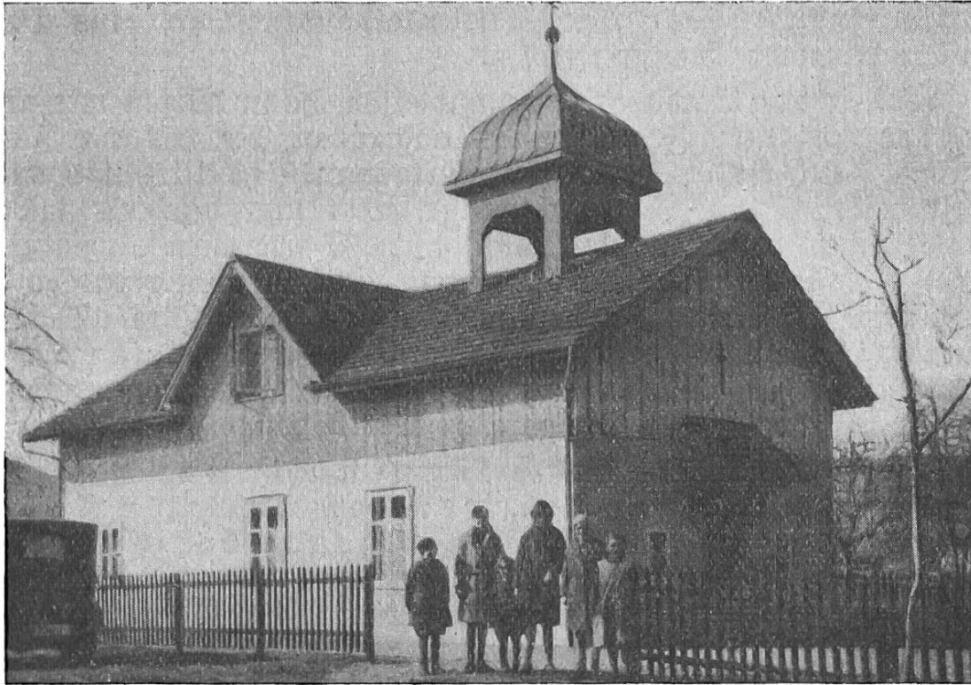
St. Martinuskapelle in Birmensdorf (Kt. Zürich).

Dann folgen die großen Kantone Aargau und Sankt Gallen. Beide verzeichnen neben schönen Resultaten der ordentlichen Sammlung auch recht ansehnliche außerordentliche Vergabungen. Alle Ehre dieser katholischen Opferwilligkeit.