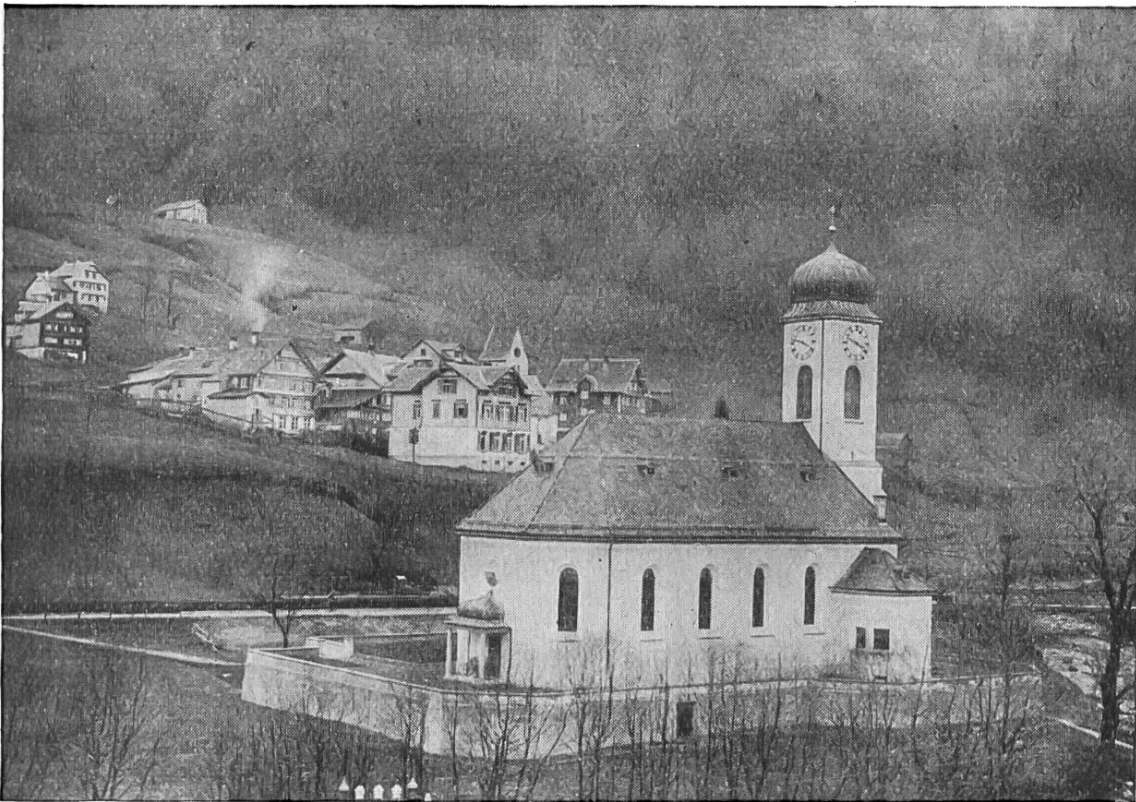
Kathol. Kirche von Stein im Toggenburg.