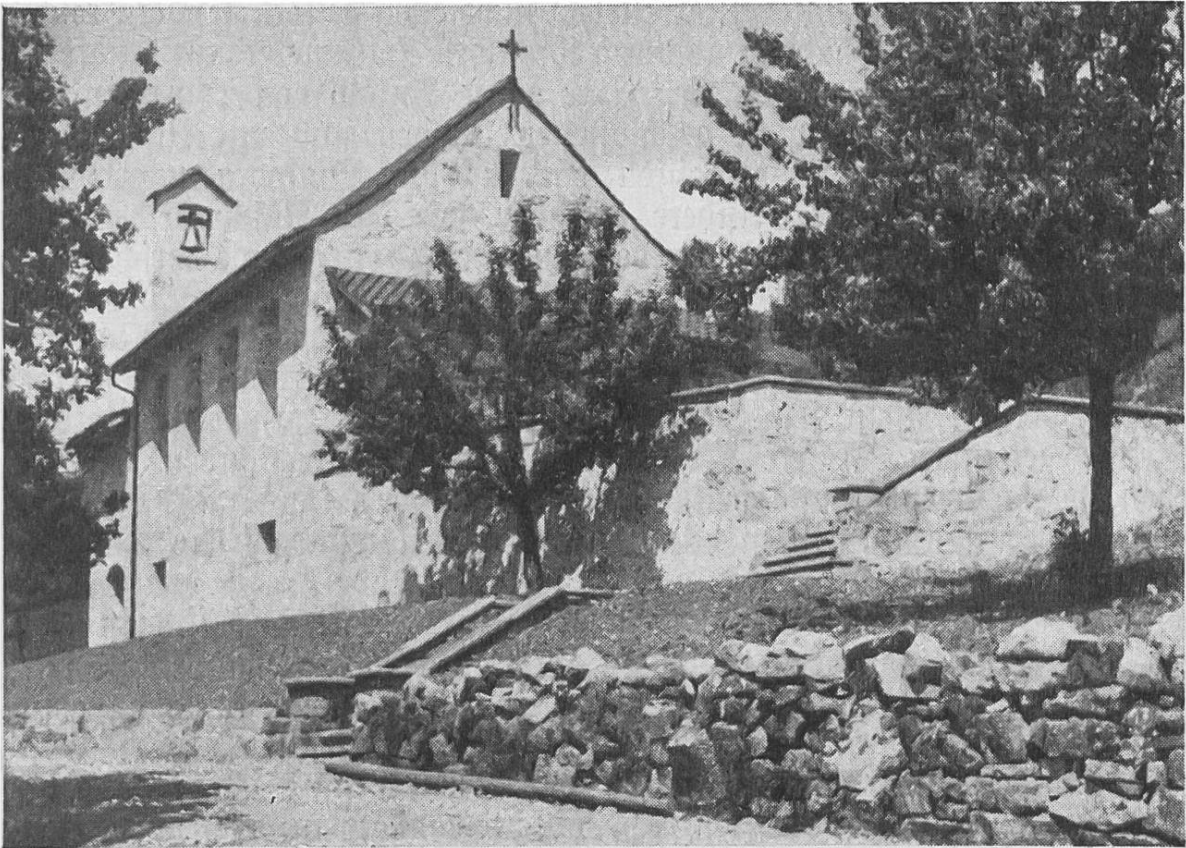
Grenzkirchlein von Schleithem in schlichtem Heimatstil

Generalversammlung der Jungfrauenkongregation konnte ich bemerken, daß zwei Kongreganistinnen seit Gründung unserer Pfarrei, also seit zwei Jahren und vier Monaten, täglich nie nach Z. (eine Bahnfahrt von beinahe einer Stunde) zur Arbeit gefahren sind, ohne nicht erst um 6 Uhr hier die hl. Kommunion empfangen zu haben. Eine andere Sodalin geht jeden Morgen vor ihrem Gang zur Arbeit in hier um 6.30 erst zur hl. Kommunion. Kein Tag ohne sie!"