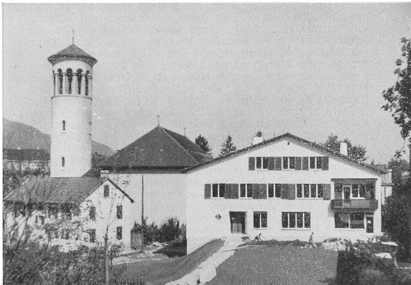
Pfarrhaus bei der St. Franziskuskirche in Zürich

Unverzagt schaut die Diasporaseelsorge auch in die Zukunft. In Brienz wurde an einem bodenständigen Liebfrauenkirchlein gebaut, während man für den Pfarrer von Meiringen anstatt der Mietwohnung ein eigenes Pfarrhaus plante und begann. In der Westschweiz wurde für die dringend notwendige Pfarrkirche von Peseux ein günstig gelegener Bauplatz erworben; ebenso kauften die Katholiken von Les Verrières den Platz für den Bau einer Kapelle. Die Pfarrei Sainte-Clotilde in Genf baut an einer Kapelle im Quartier Queue-d'Arve. Saint-François in der gleichen Stadt erwarb ein Haus im Quartier Accacias und baut dessen Erdgeschosß zur Notkapelle aus, während außer der Stadt die junge Pfarrei Pregny-Chambésy durch den Umbau eines Hauses Pfarrwohnung und Vereinsäle bekommt.