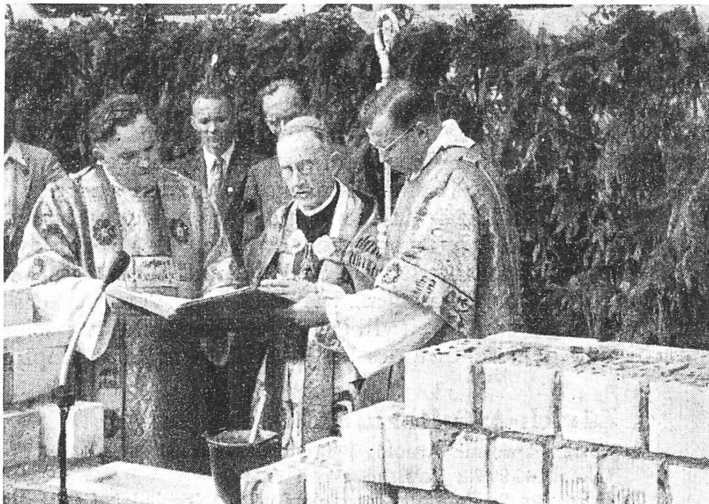
Segnung des Grundsteines durch den hochwürdigsten Bischof von Chur

In väterlicher Ergriffenheit dankte der Bischof unserm guten, katholischen Volke, das uns den Bau ermöglichte. Er schliesst an den Dank die Bitte, auch fernerhin zu helfen, damit das Werk vollendet werden könne.