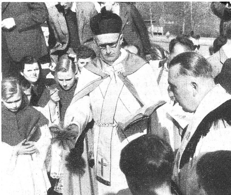
Segnung des Grundsteines der Maria-Hilf-Kirche in Zürich-Leimbach

Taufen 38, davon Konversionen 5; Beerdigungen 27; Ehen 34, davon gemischte 15; schulpflichtige Unterrichtskinder 386. Auswärtige Unterrichtsstation: Leimbach.