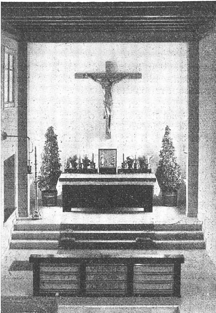
Huttwil, Chor der Bruder- klausenkirche

Durch das Entgegenkommen des hochw. Herrn Pfarrers in Burgdorf, zu dessen Pfarrei Utzenstorf eigentlich gehört, ist es möglich geworden, jeden Sonntag, statt wie bisher nur alle 14 Tage, Gottesdienst zu halten. Wir sind dafür aufrichtig dankbar, wie auch für den Beitrag, den die römisch-katholische Kirchgemeinde Burgdorf alljährlich an den Unterhalt des Lokals gibt. Ausserordentliche Ereignisse sind nicht zu verzeichnen. Die Gläubigen machen schön mit, und wir wollen das Mögliche tun, sie zu betreuen.