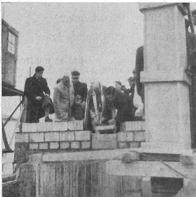
Grundsteinlegung der Kirche in Lausanne-Montoie

Was die Seelsorge betrifft, verdient an erster Stelle Erwähnung die Schaffung von vier neuen religiösen Zentren: Die Pfarr-Rektorate in Lausanne: La Sallaz , Bellevaux und Chailly , wovon die beiden ersten von der Pfarrei Notre-Dame und das dritte von Saint-Rédempteur losgetrennt wurden, und das Pfarr-Rektorat Aubonne-Bière , zusammengesetzt von schon seit 1917 und 1929 bestehenden Gottesdienststationen. Bisher von den Pfarreien Morges und Rolle besorgt, wohnt nun ein Pfarr-Rektor in Aubonne . Infolge der grossen Entwicklung wurden ferner sowohl für Lausanne-Montoie als auch für Moudon neue Vikariate geschaffen. Moudon, eine weitausgedehnte