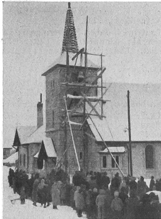
Glockenaufzug in Cernier

Infolge dieser Zunahme der katholischen Bevölkerung sind da und dort die Kirchen zu klein geworden. Für den Augenblick begnügt man sich mit vermehrten Gottesdiensten. In Le Locle aber liess sich die Erweiterung der Kirche nicht mehr aufschieben. Peseux (bei Neuenburg) steht vor dem Beginn eines Kirchenbaues, nachdem die Platzfrage eine Lösung gefunden. In diesen beiden Fällen darf dank der seit Jahren geäußerten, leider noch ungenügenden Fonds auf baldige Verwirklichung der Bauvorhaben gedacht werden. Die Pfarreien von St-Blaise und von Cernier feierten am 3. März, resp. am 17. Dezember die Weihe der Glocken, die nun Sonntag für Sonntag die Gläubigen zum Gottesdienst rufen werden.