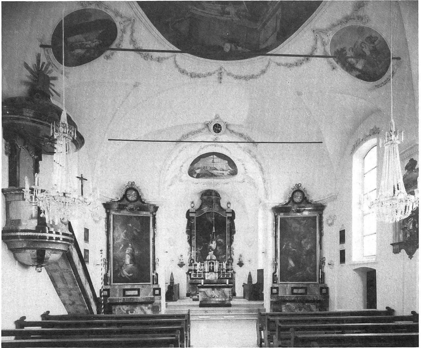
Kirche in Bauen nach der Renovation