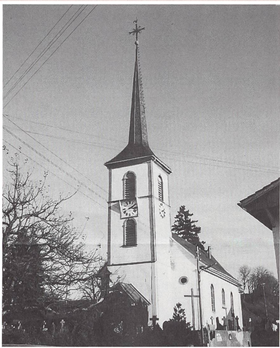
Le Châtelard FR