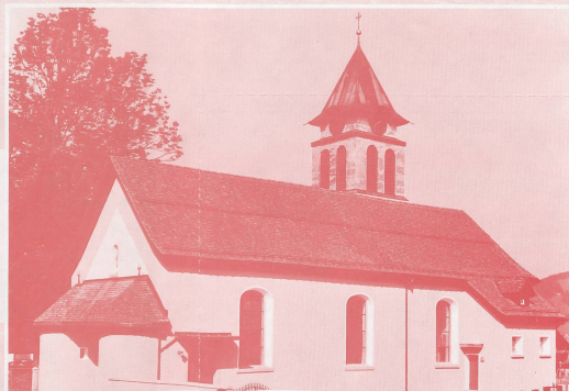
Kirche St. Johannes Nepomuk in Gross SZ

Fr. 1'795'874.96 (1996: Fr. 1'763'985.37) Zunahme: Fr. +31'889.59