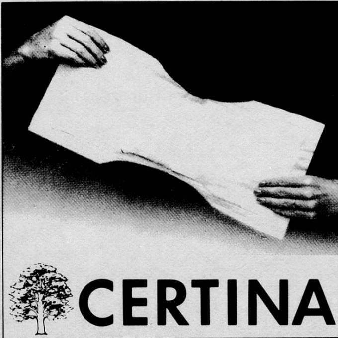
Inkontinenz-Vorlagen «normal» und «extra»