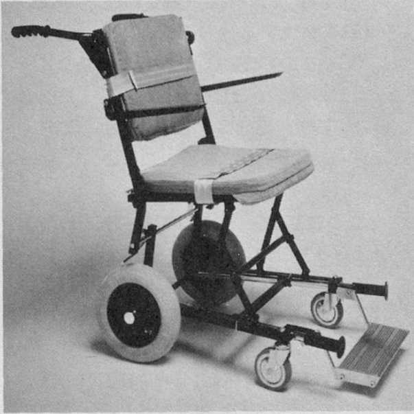
Transport- und Reisedstuhl