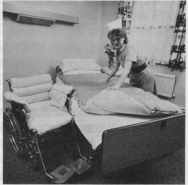
Anti-Dekubitus Matratze und Kissen