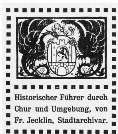
Abb. 394 Chur. Titelvignette, gezeichnet von Architekt Martin Risch 1909, in Abwandlung der Schnitzerei von 1525 über dem Rathausportal, welche das von Basiliken gehaltene Stadtwappen darstellt. Vgl. Abb. 12