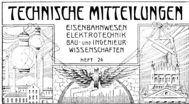
Abb. 3 TM . Kopf des Titelblattes, verwendet um 1910 bis 1920.

UKD = Unsere Kunstdenkmäler . Mitteilungsblatt für die Mitglieder der GSK, Bern 1950 ff. / Nos monuments d'art et d'histoire (NMAH) . Bulletin destiné aux membres de la SHAS, Berne 1950 ss. / I nostri monumenti storici (NMS) . Bollettino per i membri della SSAS, Berna 1950 ss.